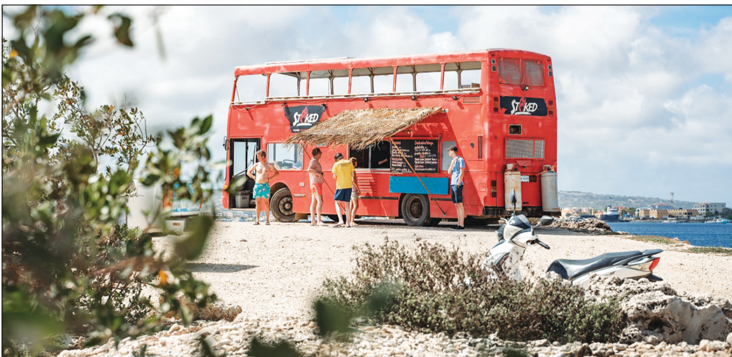
Leahy Stoked Food Truck